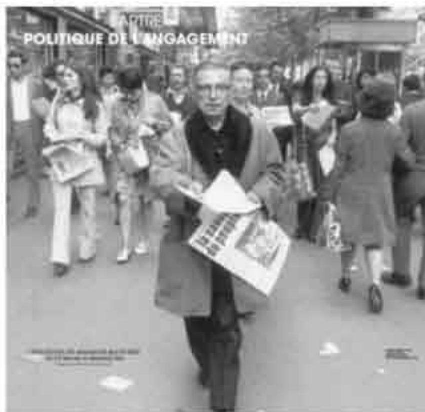
Sartre: Política e Engajamento

A existência humana se constitui a partir de escolha subjetiva, ou seja, individual, mas nunca definitiva e isolada do resto da humanidade. “Escolher ser isto ou aquilo é afirmar, concomitantemente, o valor do que estamos escolhendo, pois não podemos nunca escolher o mal” (Sartre, p. 6) Todas as ações que o homem executa, são de sua inteira responsabilidade. Podendo então estar frente a um leque de escolhas e optar por aquela que lhe convir, ou mesmo não optar por nenhuma e ainda estar escolhendo, ou seja, escolheu não escolher. Mas está ciente de que arcará com todas as conseqüências. A liberdade muito mais que um prêmio pode traduzir-se em castigo, pois, ao fazer as escolhas torna-se o único responsável por fazê-las. Diante do peso desta responsabilidade surge a angústia como conseqüência das escolhas feitas.