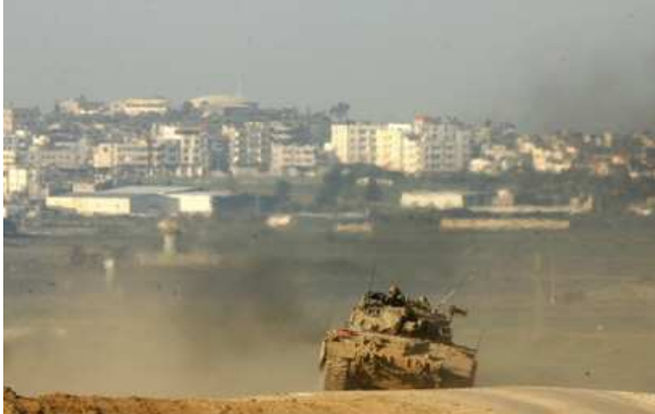
An IDF tank entering Gaza

"On the night of January 14, the bombing increased and explosions were heard every few minutes. So, we decided, my family and I, to go down to the ground floor where we stored water tanks. There, my brother said, it would be safer for all of us. We were 40 people in the storage room with all the neighbors – men, women, and children."