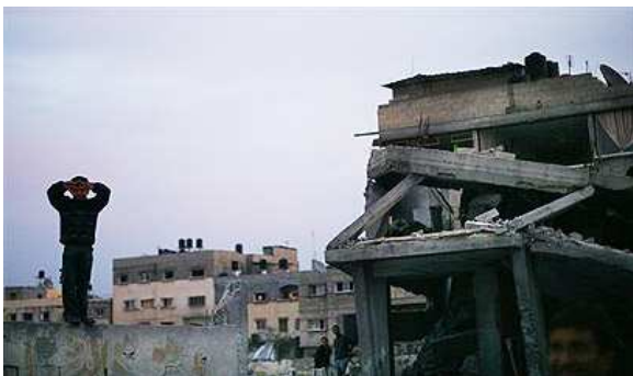
'He shouted at me, but I didn't understand'

"The soldiers entered the warehouse firing everywhere. I saw small red lights moving everywhere inside the warehouse. I saw the shadows of around 30 soldiers on the wall in front of us. At this point, A. S. shouted at us "Say katan...katan; a word in Hebrew meaning small." He was telling everyone, including the children, to say this. Everyone shouted but I did not because I was scared if they heard me they would shoot me. I then learned that katan means children. After the shouting stopped, the shooting also stopped.